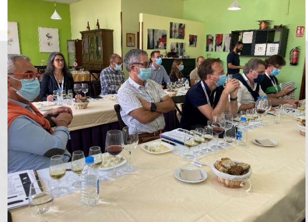
Animation pédagogique autour des vins et des fromages des 2 pays