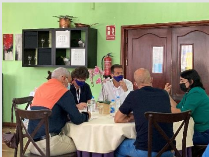
Tables rondes de présentation de projets Erasmus+ : consortium / gestion de crise / Santé et bien-être